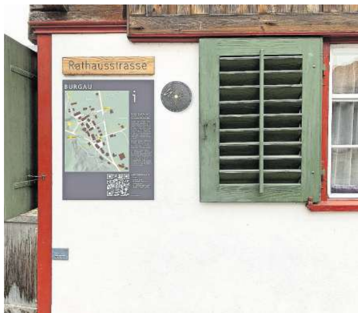
Vorgesehene Anordnung der Infotafel zum Kolumbansweg und der Plakette beim «Plätzli».