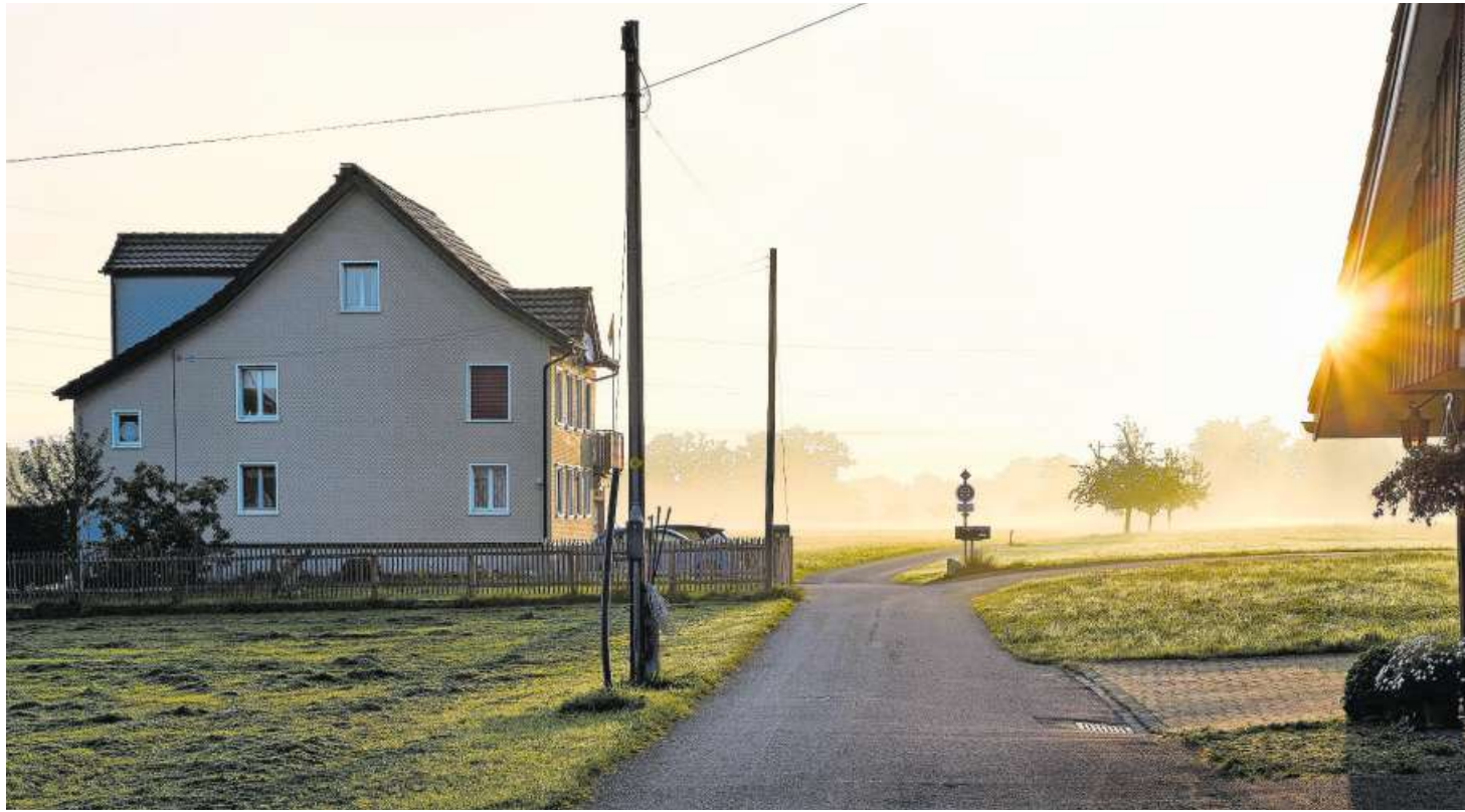
Im Weiler Burgau führt der Columbansweg – in Burgau wird die ältere Schreibweise Columban verwendet – Richtung Brückenkopf und abschliessend zur Columbanhöhle.

Auf der neunten Etappe der 500 Kilometer langen Route durch die Schweiz führt der Kolumbansweg von Magdenau nach St. Gallen. Auf dieser Strecke wandern die Pilger am Weiler Burgau vorbei. Dass Kolumban in diesem Weiler kein Unbekannter ist, davon zeugt die Tat-